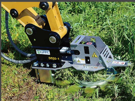
低回転で飛散が少なく安全に刈れます

日本の侵略的外来種フースト100に選ばれた刈り難い厄介な草、ウィーピングラブグラス(しなだれすずめがや)も簡単に刈ることができます。