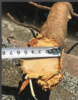
φ70までの樹木の枝や幹なら剪定可能です。