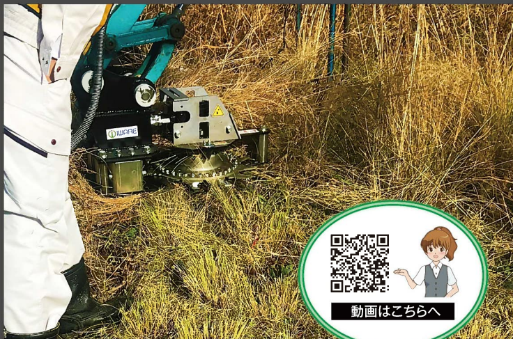
高速道路での草刈り作業風景。

私たちは、当製品をTOSA ULTRA CUTTER(トサ・ウルトラ・カッター)と命名致しました。