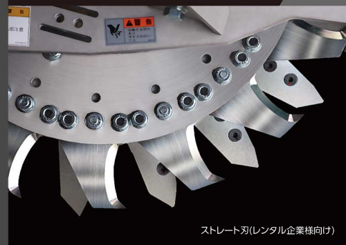
ストレート刃(レンタル企業様向け)