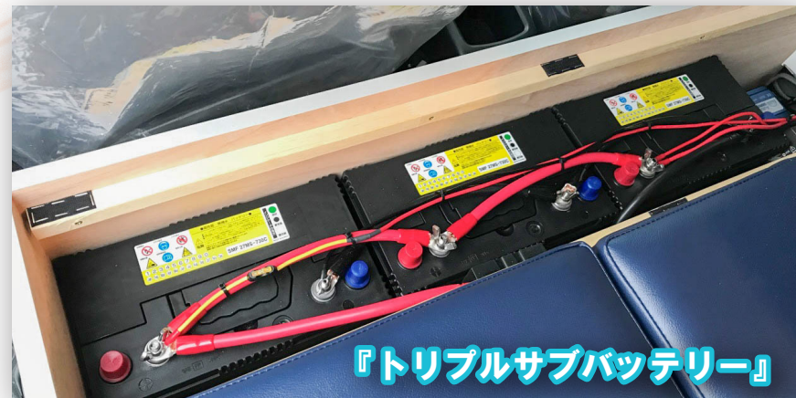
『トリプルサブバッテリー』