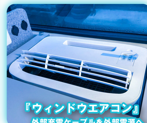
『ウィンドウエアコン』

スイッチ1つで全ての電源を管理。テーブル上に2口コンセントと12Vシガーソケット、USBソケット。テーブル下にも2口コンセントを装備。