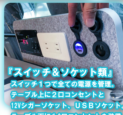
『スイッチ&ソケット類』

スイッチ1つで全ての電源を管理。テーブル上に2口コンセントと12Vシガーソケット、USBソケット。テーブル下にも2口コンセントを装備。